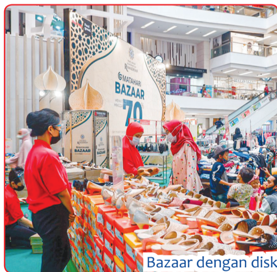
Bazaar dengan diskon hingga 70 persen.