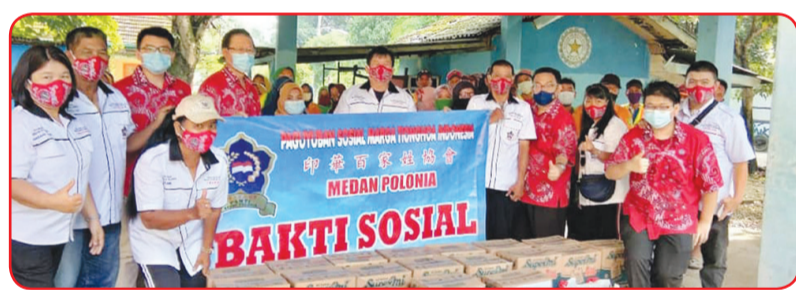
Pengurus PSMTI Kec. Medan Polonia berfoto bersama sebelum pelaksanaan kegiatan Baksos Idul Fitri 2021.

MEDAN (IM) - Menyambut hari raya Idul Fitri, Pengurus PSMTI (Paguyuban Sosial Marga Tionghoa Indonesia) Kec. Medan Polonia, Minggu (25/4) lalu menyelenggarakan Baksos Idul Fitri 2021.