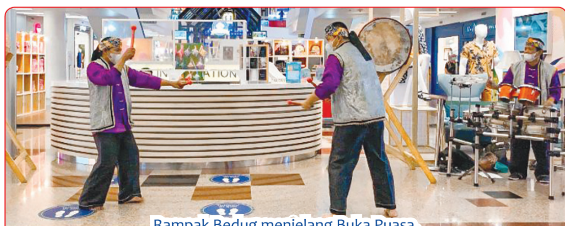
Rampak Bedug menjelang Buka Puasa.