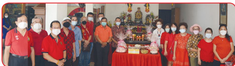
FOTO BERSAMA: Pengurus Yayasan Sosial Laut Selatan Jakarta dan tokoh yang hadir berfoto bersama.

tentram juga diberikan kesehatan serta kegiatan perkumpulan berlangsung lancar.