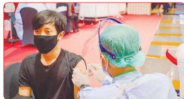
Pekerja ritel sedang divaksin di salah satu Mall.

Kami berharap kegiatan vaksinasi di lima mall dengan lokasi yang strategis ini dapat membantu pemerintah untuk mencapai target tahap ke-2. • jhk/din