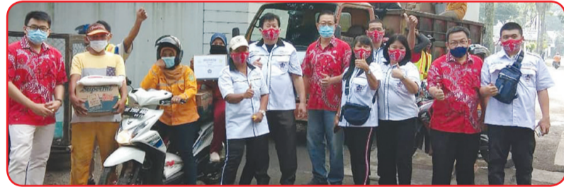
Pengurus PSMTI Kec. Medan Polonia berfoto bersama para petugas kebersihan dalam kegiatan Baksos Idul Fitri 2021.

Dalam kesempatan tersebut dibagikan 200 paket Idul Fitri kepada para petugas kebersihan dan warga kurang mampu. Paket Idul Fitri yang diberikan terdiri dari beras, mie instan, biskuit dan kue kering. Pembagian paket cinta kasih tersebut dilakukan secara langsung door to door. Sehingga diterima langsung oleh mereka yang berhak memperolehnya.