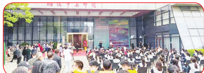
PEMBUKAAN: Upacara pembukaan Pameran lukisan "From The Solo River".

"From The Solo River". Pameran ini diselenggarakan Fujian Polytechnic Normal University, Fujian Normal University Fine Arts College, Propaganda Department of Fuqing Municipal Committee of the Communist Party of China dan United Front Work Department, Fuqing Municipal Committee of the Communist Party of China. Juga didukung Fuqing City