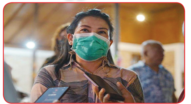
Walikota Singkawang Tjhai Chui Mie saat diwawancarai awak media.

kegiatan, penutupan sementara, pencabutan izin usaha, hingga dikenakan sanksi pidana. Sementara bagi ASN, sanksi diberikan menyesuaikan peraturan perundang-undangan yang mengatur disiplin Pegawai ASN atau denda administratif berupa tidak dibayarkan tunjangan ASN. Sedangkan bagi tenaga kontrak, sanksi meliputi teguran lisan atau teguran tertulis, kerja sosial, hingga diberhentikan. • idn/din