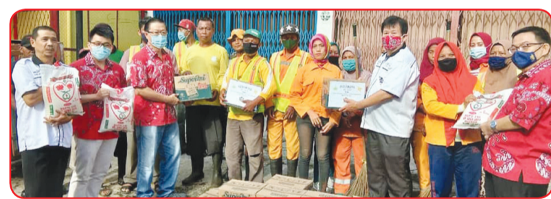
Pimpinan PSMTI Kec. Medan Polonia menyerahkan paket sembako kepada para petugas kebersihan.

Dalam kesempatan tersebut dibagikan 200 paket Idul Fitri kepada para petugas kebersihan dan warga kurang mampu. Paket Idul Fitri yang diberikan terdiri dari beras, mie instan, biskuit dan kue kering. Pembagian paket cinta kasih tersebut dilakukan secara langsung door to door. Sehingga diterima langsung oleh mereka yang berhak memperolehnya.