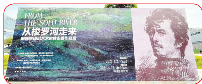
Reklame Pameran lukisan "From The Solo River".